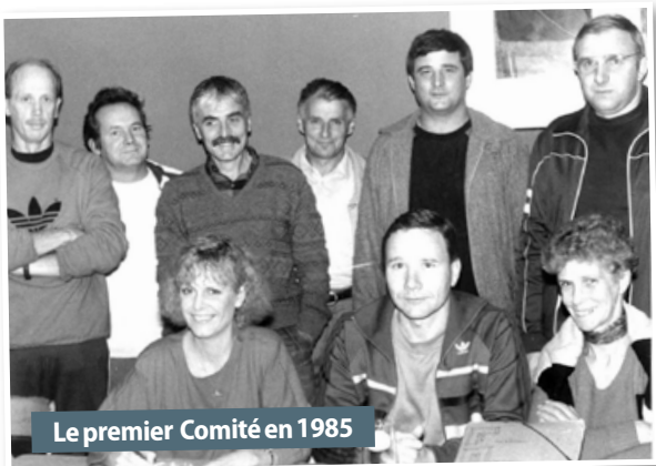
Le premier Comité en 1985