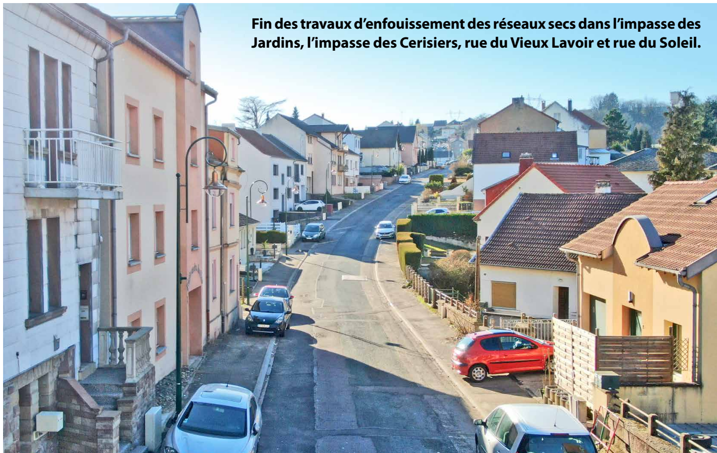
Fin des travaux d'enfouissement des réseaux secs dans l'impasse des Jardins, l'impasse des Cerisiers, rue du Vieux Lavoir et rue du Soleil.