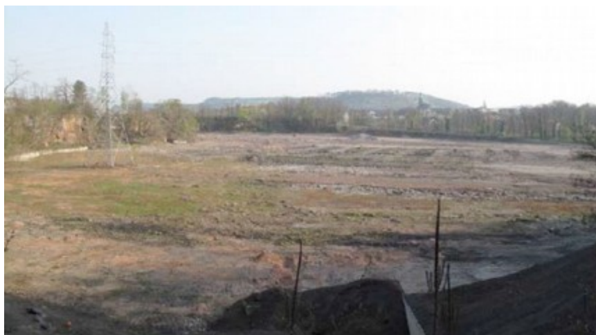
Extrait de l'étude d'impact

L'Ae recommande au pétitionnaire de reprendre l'analyse paysagère sur les points suivants :