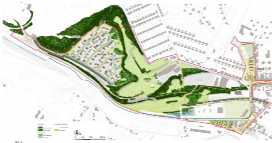
Plan général de la ZAC

Le projet de lotissement est inclus dans la zone d'aménagement concerté (ZAC) de la Vallée de la Merle (50 ha), dont le dossier de création a fait l'objet d'un avis de l'Ae (préfet) en date du 21 mars 2014 et dont la réalisation a été approuvée par délibération du conseil communautaire de Freyning-Merlebach en date du 10 juillet 2015.