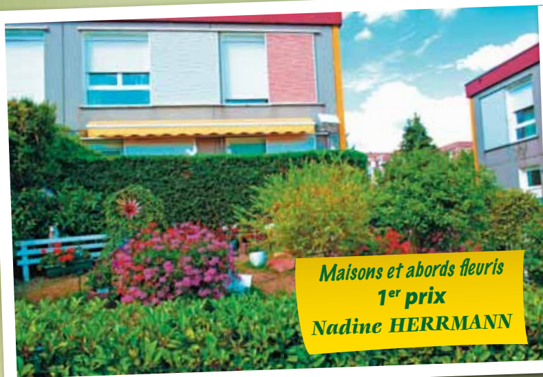
Maisons et abords fleuris 1 er prix Nadine HERRMANN

Décors et couleurs. Avec beaucoup de goût, ils se sont donnés du mal pour offrir à la vue des passants de très originales compositions florales et artistiques : un hommage de la Ville et une reconnaissance à tous ceux qui oeuvrent pour rendre notre ville plus jolie et plus accueillante !