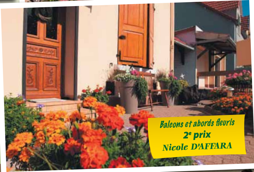
Balcons et abords fleuris 2 e prix Nicole D'AFFARA