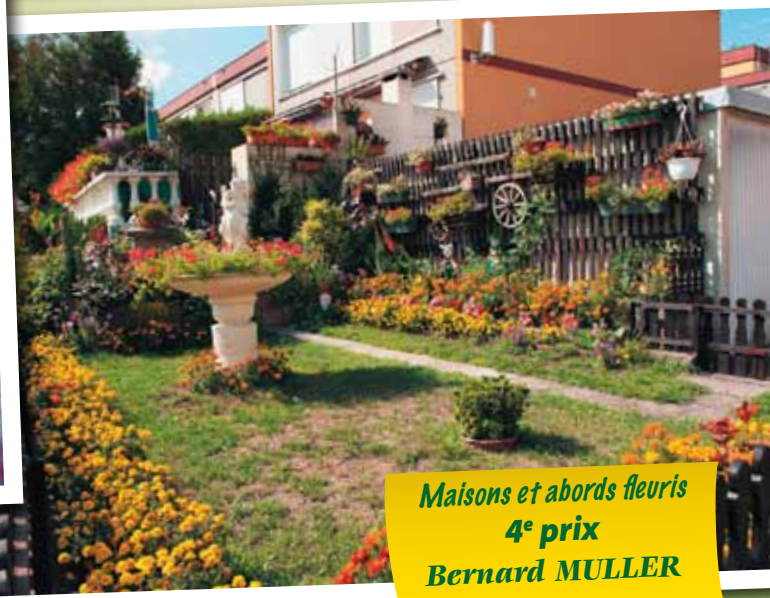
Maisons et abords fleuris 4 e prix Bernard MULLER