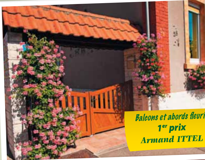
Balcons et abords fleuris 1 er prix Armand ITTEL