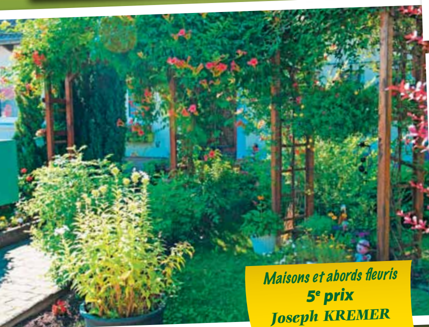
Maisons et abords fleuris 5 e prix Joseph KREMER