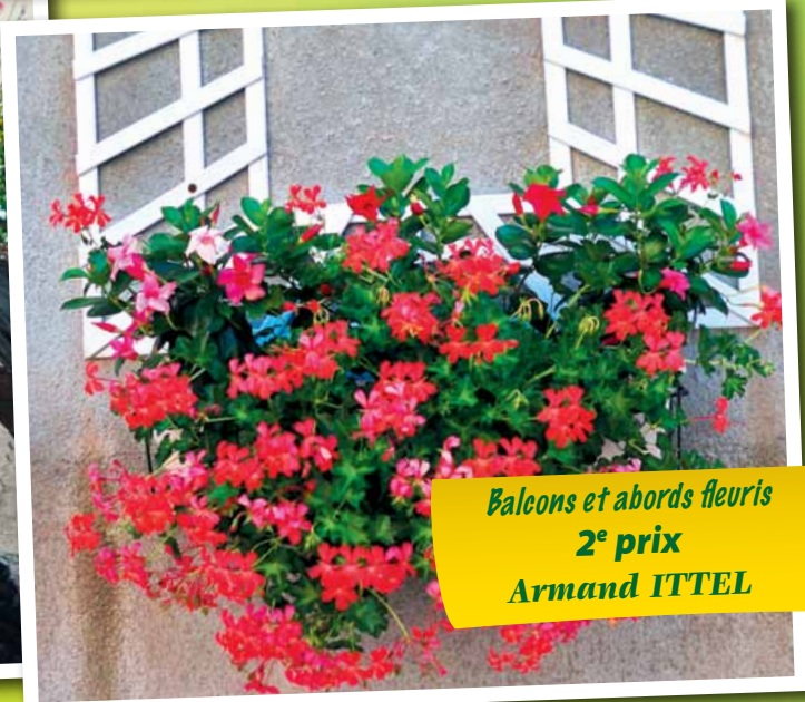
Balcons et abords fleuris 2 e prix Armand ITTEL