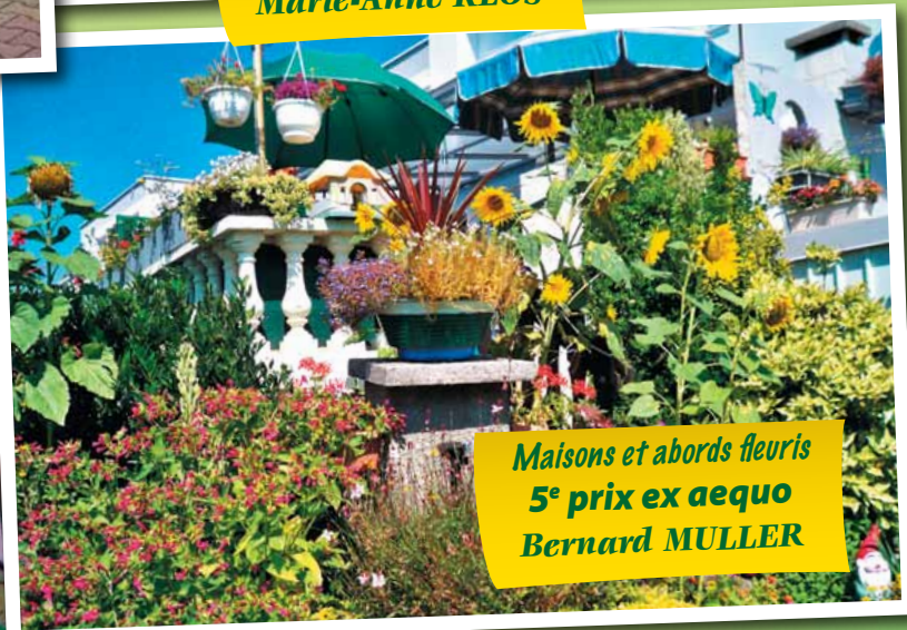
Maisons et abords fleuris 5 e prix ex aequo Bernard MULLER