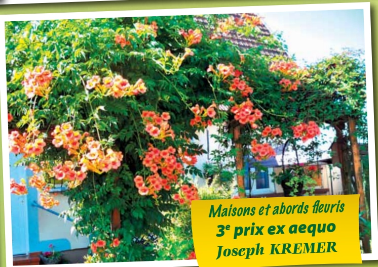
Maisons et abords fleuris 3 e prix ex aequo Joseph KREMER