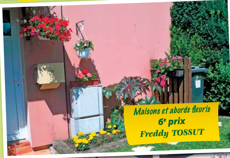
Maisons et abords fleuris 6 e prix Freddy TOSSUT