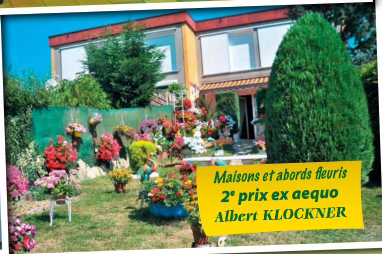
Maisons et abords fleuris 2 e prix ex aequo Albert KLOCKNER