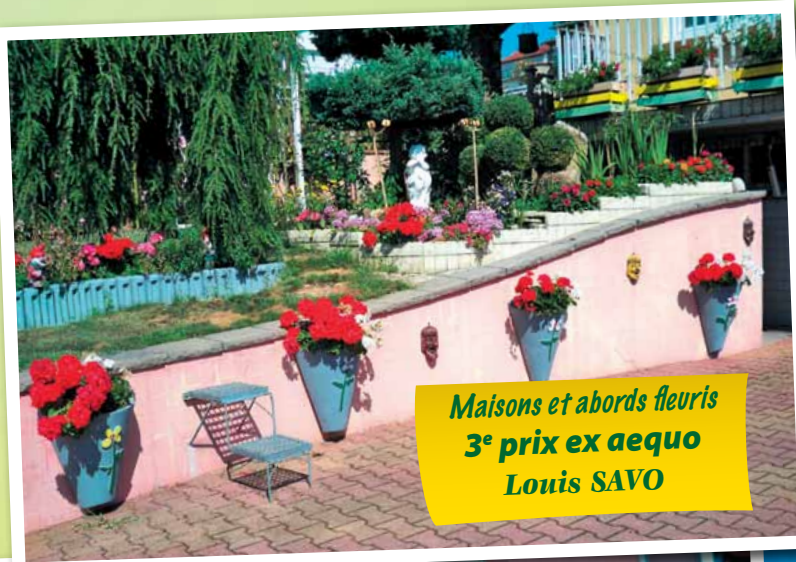
Maisons et abords fleuris 3 e prix ex aequo Louis SAVO