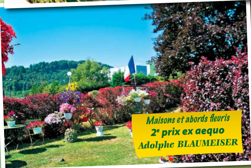
Maisons et abords fleuris 2 e prix ex aequo Adolphe BLAUMEISER