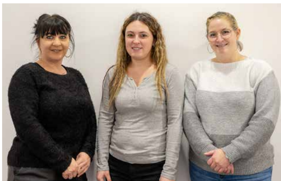
Les agents du recensement

Vous pouvez aussi vous rendre en Mairie dans votre structure France Services où les conseillères vous aideront dans cette démarche numérique.